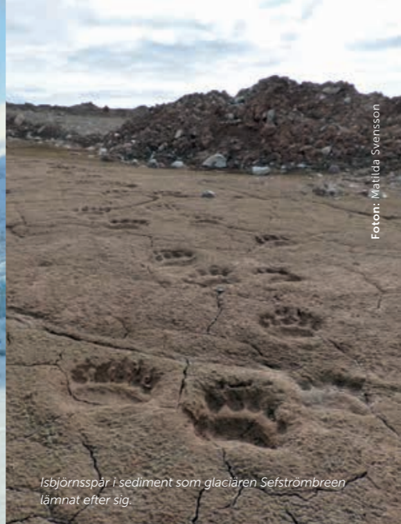
Isbjörnsspår i sediment som glaciären Sefströmbreen lämnat efter sig.