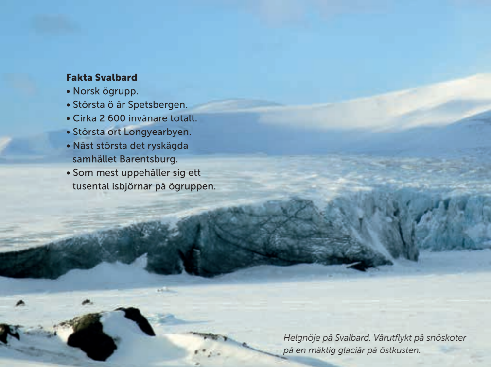
Helgnöje på Svalbard. Vårutflykt på snöskoter på en mäktig glaciär på östkusten.