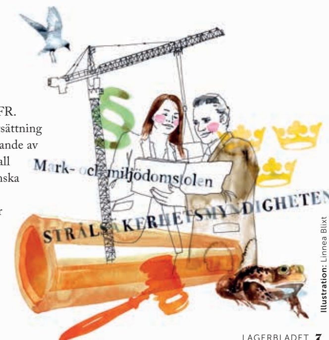
Illustration: Linnea Blixt

SSM:s ja är ett steg närmare en utbyggnad av SFR. Utbyggnaden är en förutsättning för slutligt omhändertagande av låg- och medelaktivt avfall från rivningen av de svenska kärnkraftverken. Nästa steg i miljöprövningen är huvudförhandlingen i Mark- och miljödomstolens som ska hållas i höst.