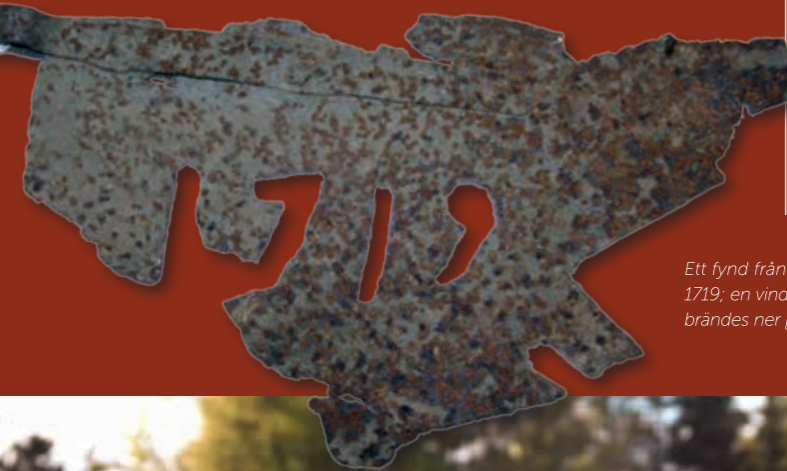
Ett fynd från förr. Ett av de få föremål som finns kvar efter rysshärjningarna i Östhammar 1719; en vindflöjel som satt på ett av stadens hus. Hela Östhammar och hela Öregrund brändes ner på bara två dagar.

Vi skulle kunna fylla hela Lagerbladet med intressanta fakta om hur det gick till när ryssarna brände ner sju städer, tio stora bruk och herresäten, och gjorde nära 20 000 människor hemlösa för 300 år sedan. Och hur fungerade "ryssugnar" på