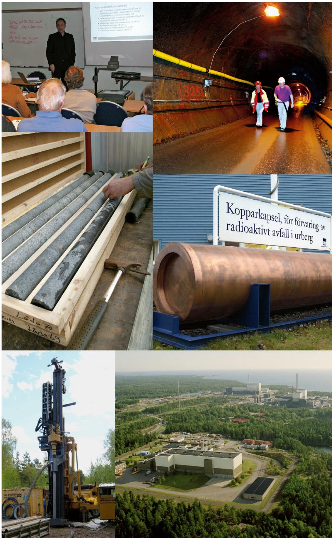
Figur 2-3. Exempel på bilder i tidningarnas bevakning. (Mötesbild: Nyheterna 2005-11-18, Bergtunnel: Oskarshamnstidningen 2002-07-18, Kopparkapsel: Nyheterna 2005-11-02, Borrkärnor, borrhåtor och kärntekniska byggnader:.)