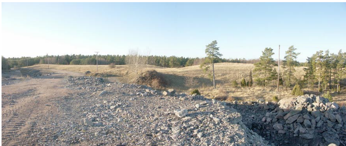
Figur 7-1. Befintligt bergupplag på Hålö visar att täckning och grässådd inte läker några sår.

De planerade anläggningarna och bergupplagen har med kärnkraftsområdets storskalighet att göra och det är att föredra att de hamnar på Simpevarpshalvön eller inom redan påverkade områden (figur 7-1 och 7-2).