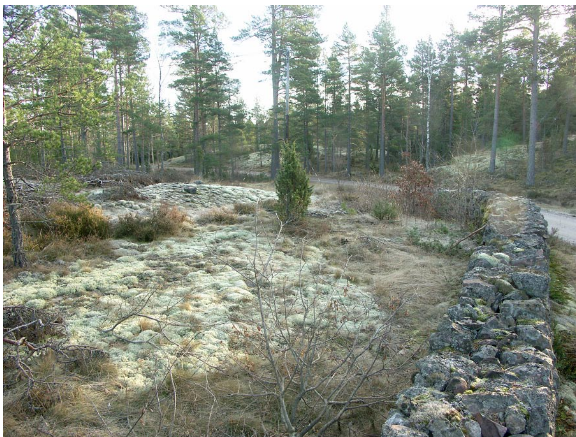
Figur 6-1. Den karga artfattiga skogstypen täcker stora delar av analysområdet.

Jordbruksmarken ligger i smala sprickdalar på ett mycket karaktäristiskt sätt (figur 6-2). Öppna längsgående diken följer lågpunktslinjen i en till synes platt åkermark. Dessa små och smala, men tydliga, landskapsrum med påtagliga riktningar är viktiga för orienteringen i landskapet. För övrigt är landmärkena och utblickarna få eller inga och landskapet är ganska svårorienterat. Tack vare jordbruksmarkernas läge i de vattensjuka dalgångarna söker vägarna sig fram tvärs dalstråken. Där det har funnits möjlighet ligger de längs landskapets vattendelare, som den äldre vägen mellan Laxemar och Hultenäs.