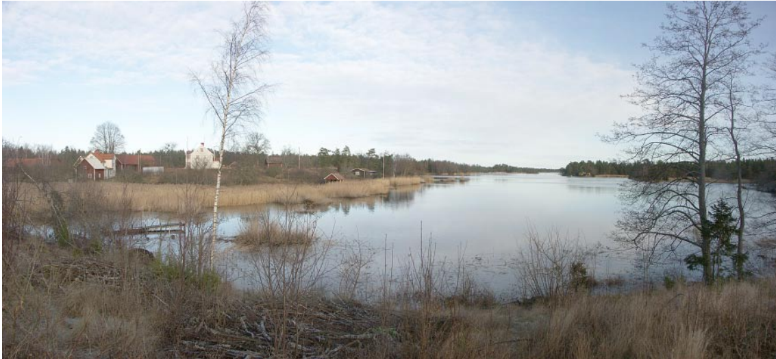
Figur 5-2. Vy längs viken vid Ekerum, ett exempel på hur de tydliga riktningarna framstår i landskapet.