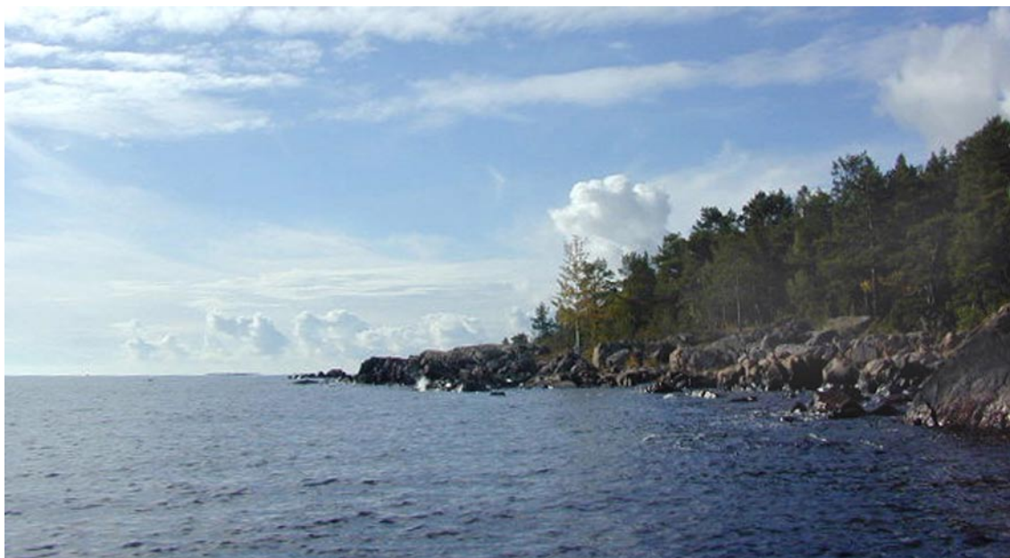
Figur 4-1. Det är bara den röda graniten som står emot havet när vågorna kastas mot land. Ävrös kust sedd söderut.

Kusten utan skärgård är sällsynt i den här trakten. Simpevarpshalvöns kvalitéer är trots allt starkt försämrade av de närliggande kraftverksbyggnaderna. Ävrös kust har däremot en karaktär som kvarstår, trots att ön i övrigt förlorat stora landskapliga värden genom att kulturlandskapet på ön fått växa igen.