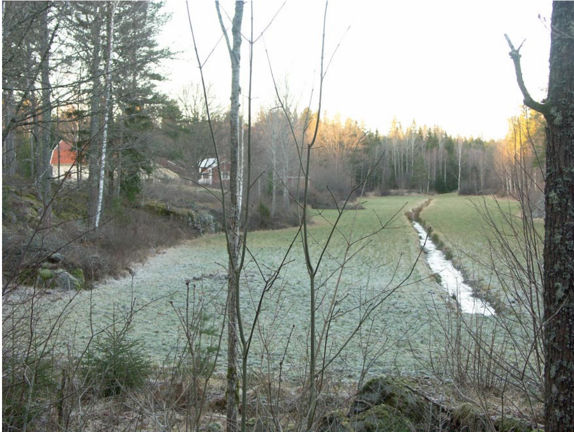
Figur 6-2. Sprickdalen vid gården Lyckorna är ett exempel på de för landskapet typiska åkermarkerna med det öppna diket i mitten.