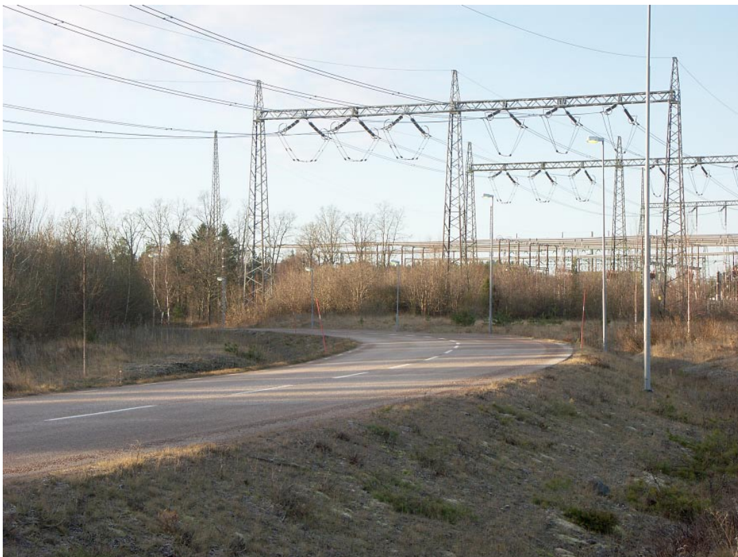
Figur 2-3. Storskalighet och dominans i byggnader, kraftledningarna och vägar präglar området.