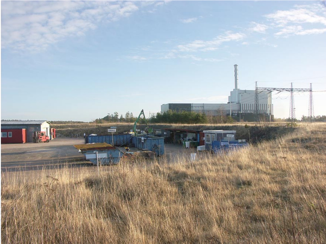
Figur 7-2. Befintliga sprängstensvallar på Simpevarpshalvön.