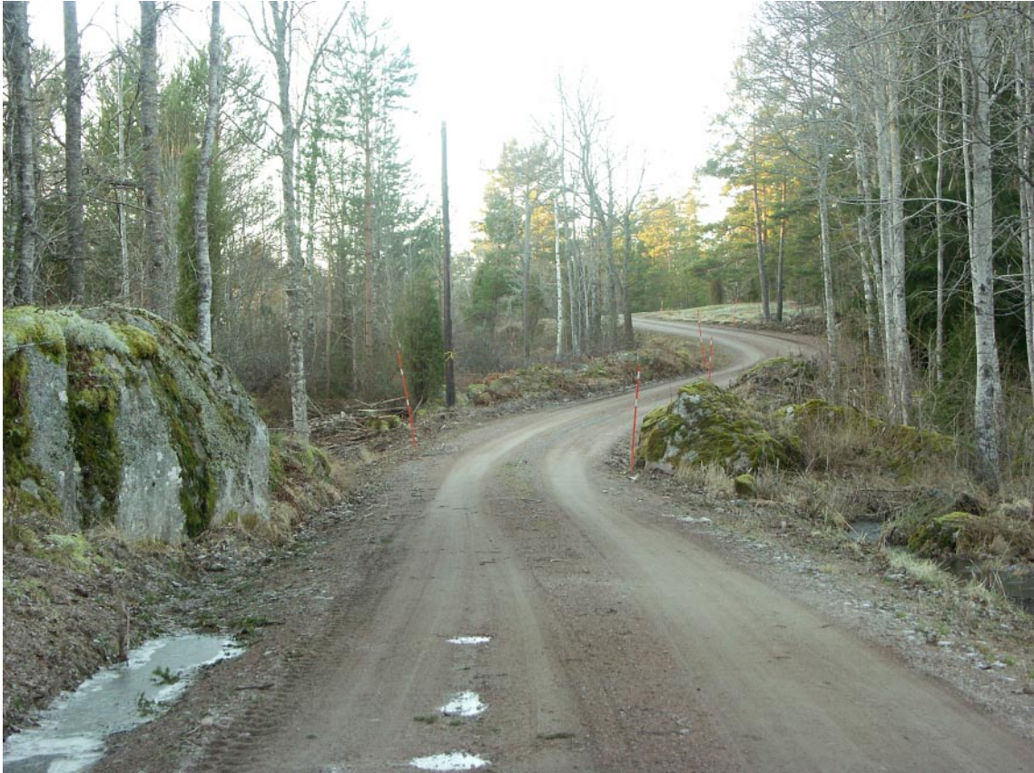
Figur 6-3. Följsam äldre väg mellan Kvarnstugan och Lyckorna gör sällskap med omgivande landskap.