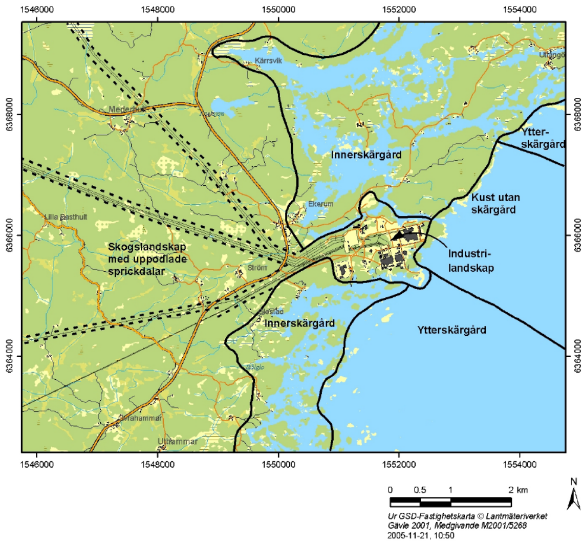
Figur 1-1. Typområden inom analysområdet Simpevarp/Laxemar.