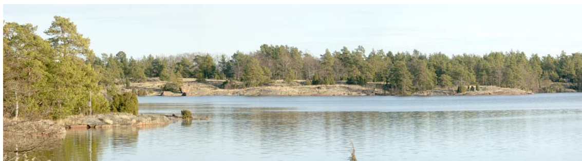
Figur 5-1. Mjukt formade hållar klädda i grått blir en förgrund till tallskogen på andra sidan viken vid Borholmsfjärden.