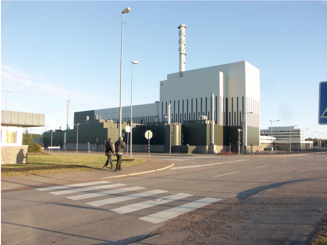
Figur 2-2. OKG III har i det närmaste en stadsmiljö kring sig. Det ursprungliga landskapet har genomgått en total omvandling.