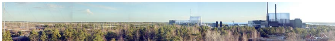
Figur 2-1. Kraftverksblocken utgör landmärken på Simpevarpshalvön.

”Kommunen med energi” är huvudrubrik på Oskarshamns kommuns hemsida. Verken representerar något positivt för kommunen. Likaså skriver man slagkraftigt: ”Här förenas teknik och genuin smålandsmiljö vid ett av världens vackrast belägna kärnkraftverk.”